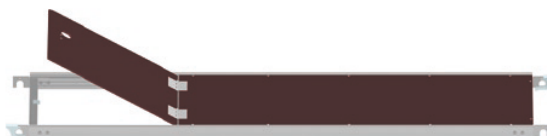
Podlážka s otvorem 1,8 m 2,70 x 0,60 m / xxx kg