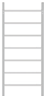
Vertikální rám 1,96 m 1,96 x 0,80 m / 7,1 kg