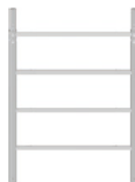
Vertikální rám 1,12 m 1,12 x 0,80 m / 4,3 kg