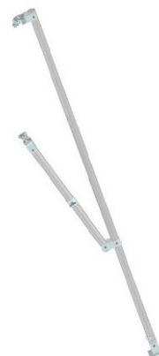
Pevný stabilizátor 2,60 m / 8,3 kg